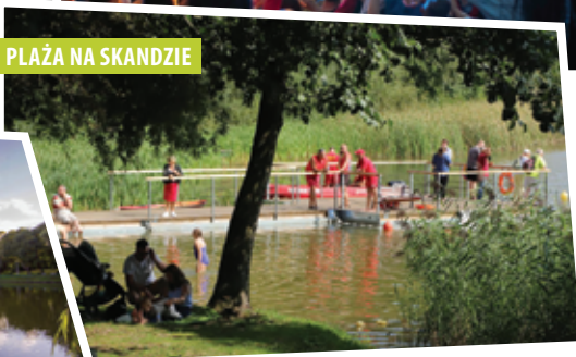
PLAŻA NA SKANDZIE