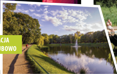
REWITALIZACJA PARKU JAKUBOWO